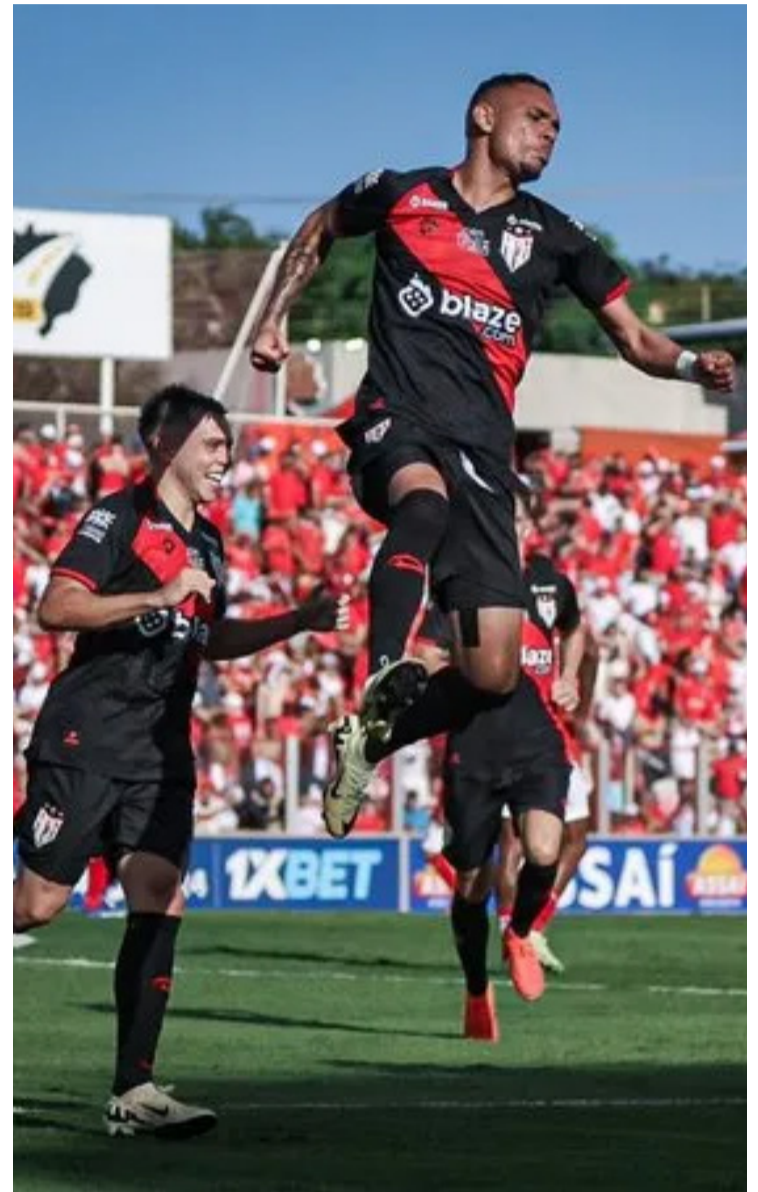
Dragão, que chegou a sua 14ª partida consecutiva sem perder, foi protagonista durante todo o jogo

Já o Vila, que busca a sua 16ª taça do Baianão, conseguiu grande virada no campeonato deste ano contra a Aparecidense na semifinal. O Tigre perdeu na ida por 2 a 0 e, devido a derrota, o técnico Higo Magalhães foi demitido. Sob o comando de Márcio Fernandes, o Tigre venceu por 3 a 0 na volta e assegurou a classificação. Mas, agora fazendo o jogo fora de casa, com torcida única do Dragão no Estádio Antônio Accioly a virada se torna bem mais difícil.