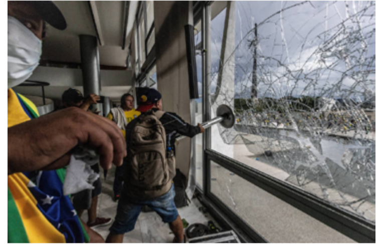
Palácio do Planalto: bolsonaristas invadem a Praça dos Três Poderes