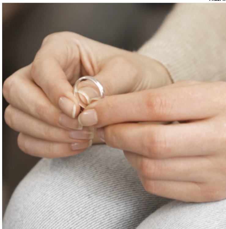
O Estado de Goiás registrou um total de 420 mil separações, marcando um ponto histórico nas dinâmicas conjugais da região no ano de 2022