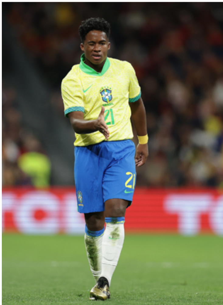
Leveza: craque diz que jogou no Bernabéu com tranquilidade

segundo tempo, com um desfecho muito comentado pelo mundo.