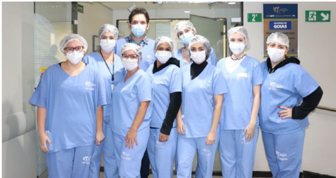
Certificação reconhece eficiência da unidade no cuidado dos usuários do Sistema Único de Saúde (SUS)

O certificado 'Top Performer' é atribuído às unidades que alcançam os melhores resultados clínicos e utilizam os recursos de forma eficiente, demonstrando excelência e