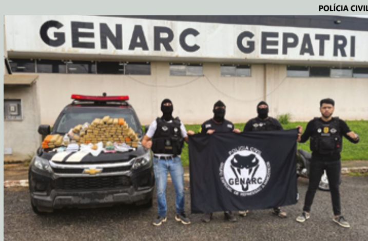
Policiais civis do Genarc apresentam as drogas apreendidas na operação realizada na região do Residencial Aldeia dos Sonhos

Segundo informações da PC, a investigação começou após uma denúncia anônima pelo WhatsApp Funcional, informando que uma residência no Residencial Aldeia dos Sonhos estaria sendo utilizada para armazenamento e comercialização de entorpecentes. Durante a apuração, a