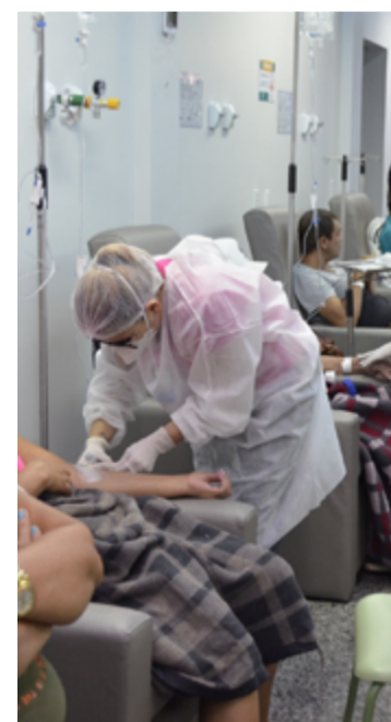
O Centro de Oncologia do HCN conta com 21 leitos de internação clínica e 15 leitos cirúrgicos

O agendamento pode ser realizado para pacientes que já têm diagnóstico confirmado ou para aqueles que necessitam definir seu diagnóstico. O ambulatório dispõe de oncologista presente de segunda à sexta-feira, atendendo toda população da região norte do estado de Goiás. Mais informações sobre a oncologia do HCN podem ser obtidas pelo telefone (62) 3121-5418. Para acompanhar o grupo de saúde de Uruaçu, o link é https://bit.ly/3kIL1xu .