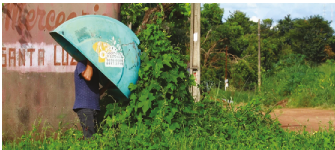
O 'Orelhão', cabine telefônica individual, ligações com fichas ou cartões; durante décadas ligou as regiões do país

O artigo 3º, por sua vez, determinava que o Poder Executivo, mediante decreto, deveria delimitar as obrigações do Estado de Goiás para com a Empresa Telefônica de Anápolis e vice-versa, dispondo, ainda, sobre o recolhimento das rendas e respectivas comprovações.