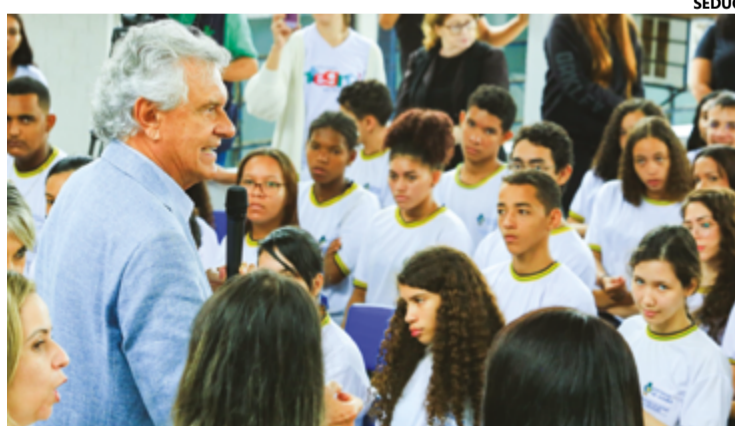
Governador Ronaldo Caiado, durante encontro com alunos da rede estadual, disse que "quanto mais educação, mais mobilidade social"